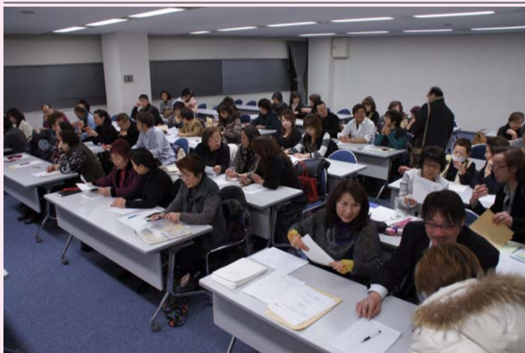
大宮ソニックシティにて