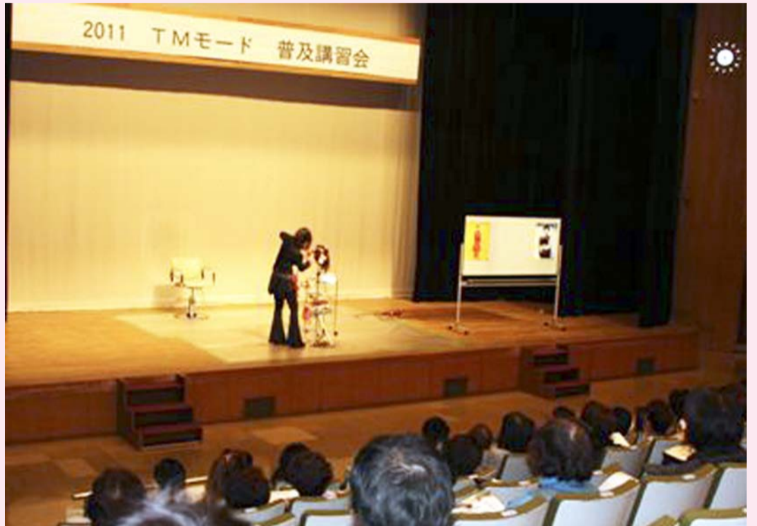
コンセプト『F(e)f』のスタイル