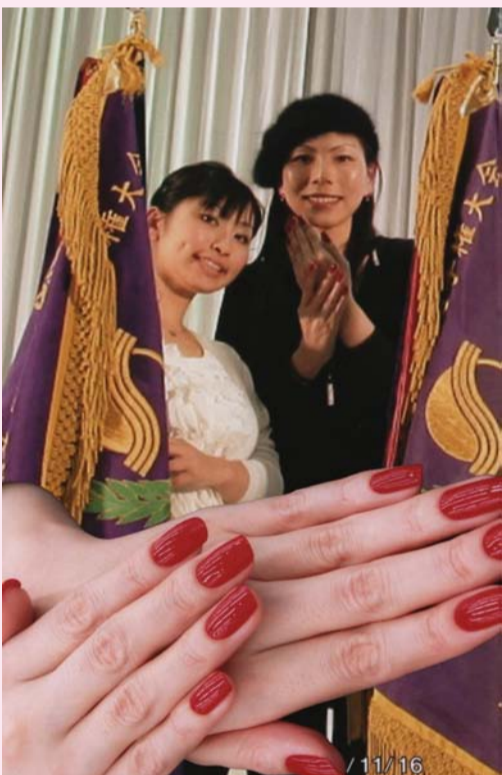
優勝旗とモデル・作品