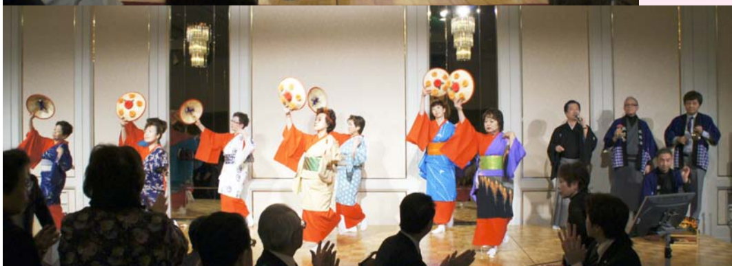
芸能部？ による パフォーマンスの数々！！