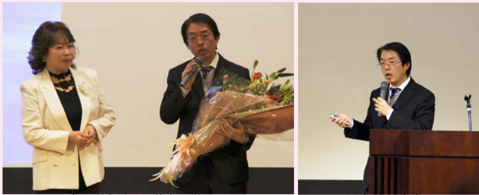
島田副会長より花束の贈呈

し、高齢者・障害者義体体験セットを装着しての実技を習得した。認定証の2月中旬に交付される。