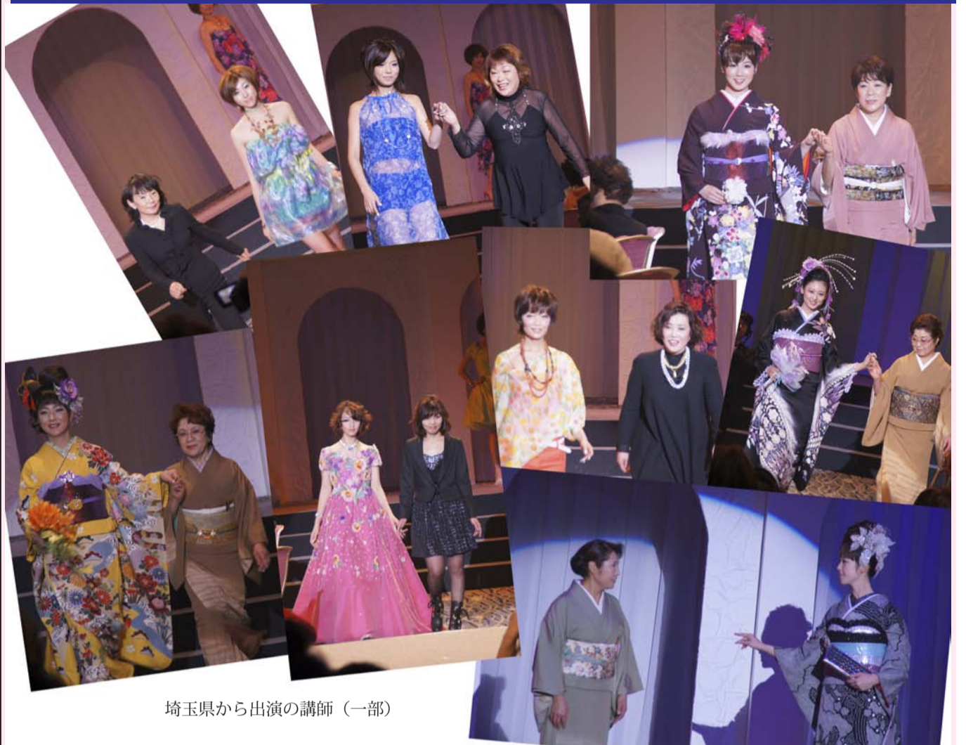
埼玉県から出演の講師 (一部)

2月1日(火) 東京都品川グランドプリンスホテル新高輪「飛天の間」において、全美容講師会によるトップマスタースモード発表会が開催された。