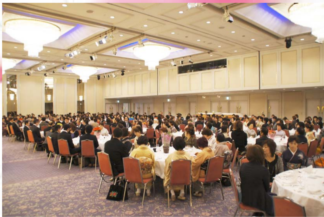
新年会会場の様子

改めまして新年明けましておめでとう御座います。組合員の皆様、よい年を迎えられたことお慶び申し上げます。 また昨年は組合事業の運営と事業の推進には、ご支援、ご協力を賜りまして厚くお礼を申し上げます。 更には大変ご多忙のところご来賓多数のご臨席を頂き盛大に