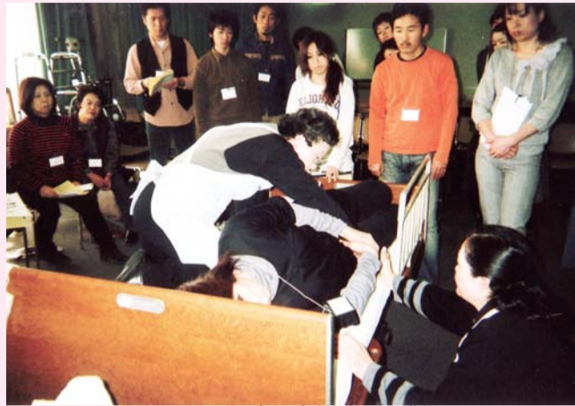
ハートフル美容師実技講習の様相